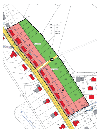
Bebauungsplan Merkwitzer Straße. Grafik: Stadt Oschatz

Gemäß § 13 Abs. 3 BauGB wird von der Umweltprüfung nach § 2 Abs. 4, vom Umweltbericht nach § 2a, von der Angabe nach § 3 Absatz 2 Satz 2, welcher Art umweltbezogener Informationen verfügbar sind, sowie von der zusammenfassenden Erklärung nach § 6a Absatz 1 und § 10a Absatz 1 abgesehen. Jedermann kann die Satzung, bestehend aus der Planzeichnung und den textlichen Festsetzungen, der Begründung vom 05.04.2022, dem Artenschutzrechtlichen Fachbeitrag und der Darlegung der Umweltbelange auf Dauer gemäß § 10 Abs. 3 BauGB im Stadtbauamt, während der Öffnungszeiten einsehen und über den Inhalt Auskunft erhalten.